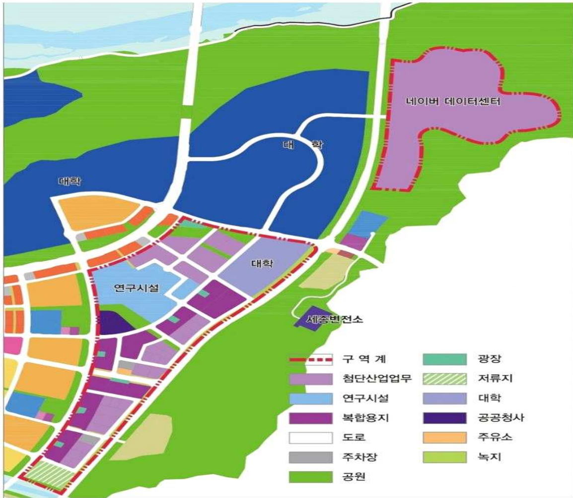
행정중심 복합도시 토지이용계획표